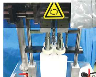
スバウトキャップ巻締