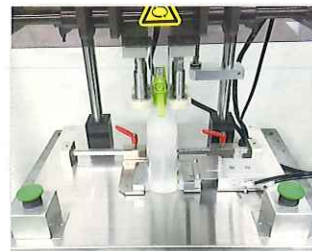
容器保持装置付タイプ