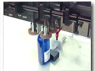
容器保持装置無しタイプ