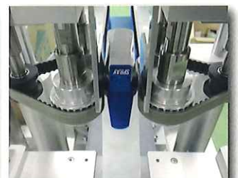
ベルト締込ヘッド